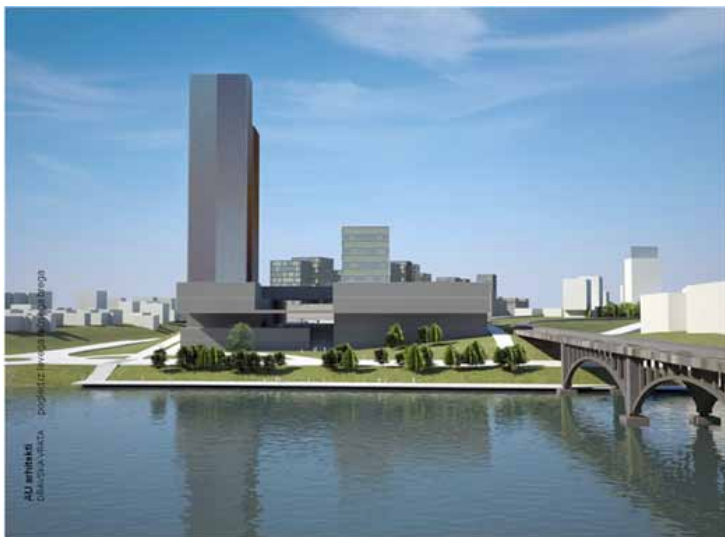
Slika 1: Predvidena zazidava v Mariboru, tako imenovani Manhattan - Iz okoljskega poročila za Občinski podrobni prostorski načrt za del prostorske planske enote Ta3-C - območje med Nasipno ulico in železnico, oktober 2008

varstvo okolja in zaprosi za odločbo, v kateri se ministristvo opredeli, ali je za sprejem plana potreben postopek CPVO ali ne.