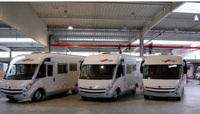
Slika 3: Proizvodne hale Carthago v Odrancih