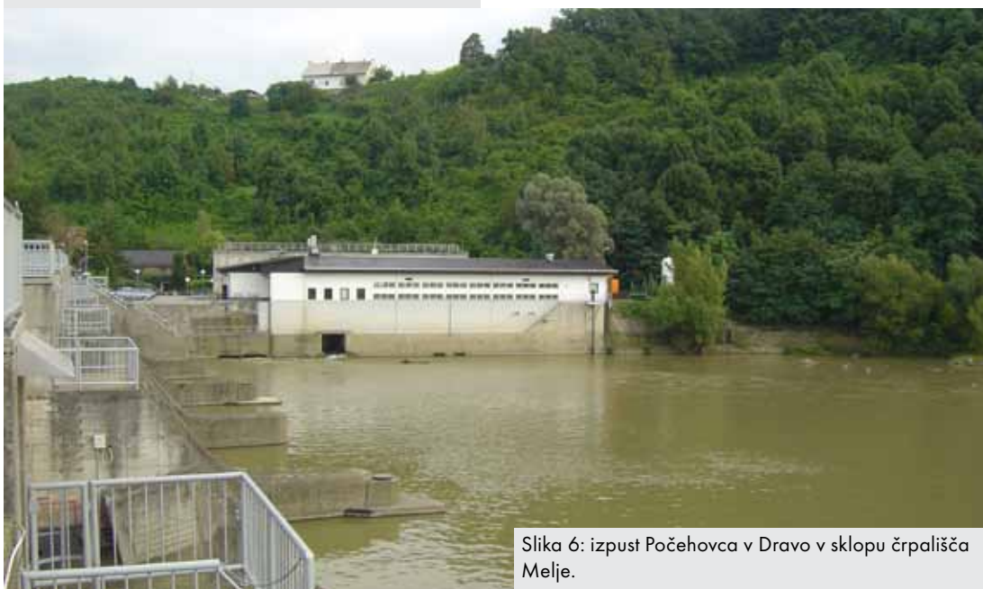
Slika 6: izpust Počehovca v Dravo v sklopu črpališča Melje.

Do izgradnje hidroelektrarne Zlatoličje so vsi površinski vodotoki kakor tudi vse veje kanalizacijskega sistemi levega brega Maribora odtekali direktno v reko Dravo. Gradnja jezusa v Melju in posledično nastanek akumulacijskega jezera in s tem poveza-