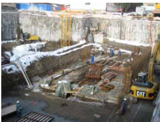
Slika 11: stari zbiralnik v Svetozarevski ulici