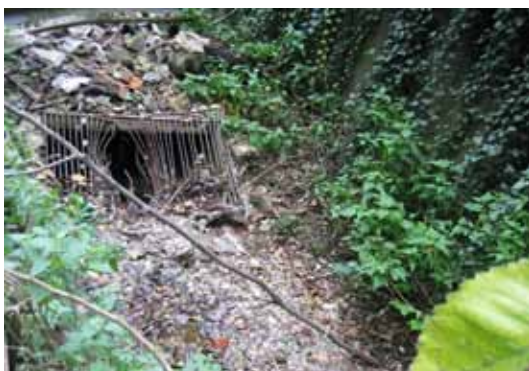
Slika 3: vtok potoka izza Kalvarije v mestno kanalizacijo