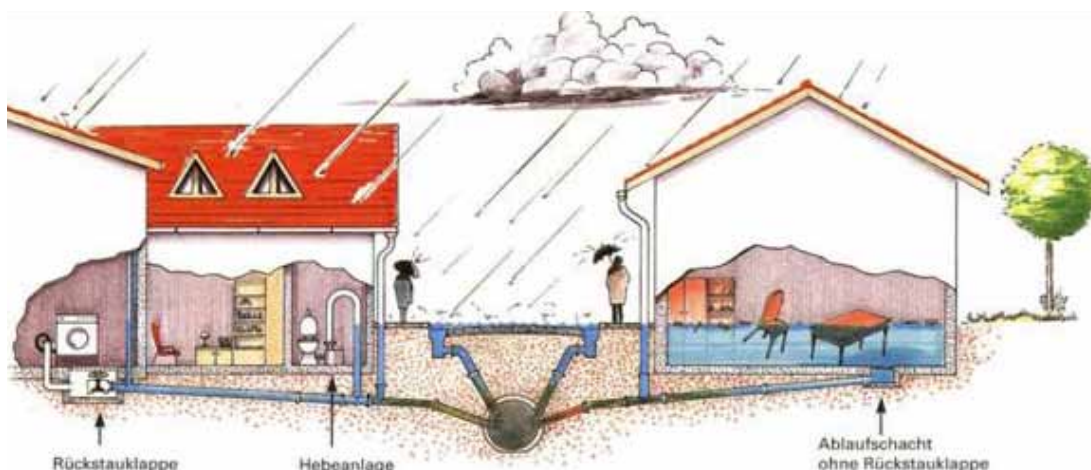
Slika 7: Koncept protipoplavne varnosti urbaniziranih območij

Za nalive s povratno dobo T < 3 - 5 let mora delovati kanalizacija tako, da je cev največ polna. Za nalive s povratno dobo T > 3 - 5 let lahko nastopi v kanalizacijski cevi tlak, vendar mora biti tlačna črta pod terenom (cesto). Za nalive z daljšo povratno dobo T = 20 - 30 let pa je potrebno preveriti, kam odteka voda po cesti in predvideti ukrepe, da ne zalije kletnih stanovanj, lokalov itd.