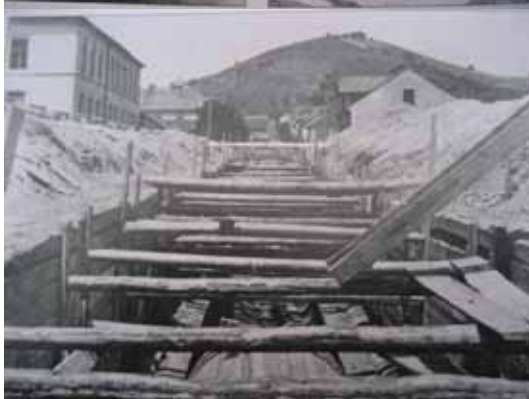
Sliki 4 in 5: izgradnja kanaliziranega Počehovca

vode tečejo po kanalizaciji v Strossmayerjevi ulici in po novi kanalizaciji, zgrajeni ob gradnji nove tržnice na Koroški cesti. Pred priključkom na levobrezni zbiralnik je zgrajen razbremenilnik, ki višek razredčenih voda v času naliva preliva direktno v Dravo.