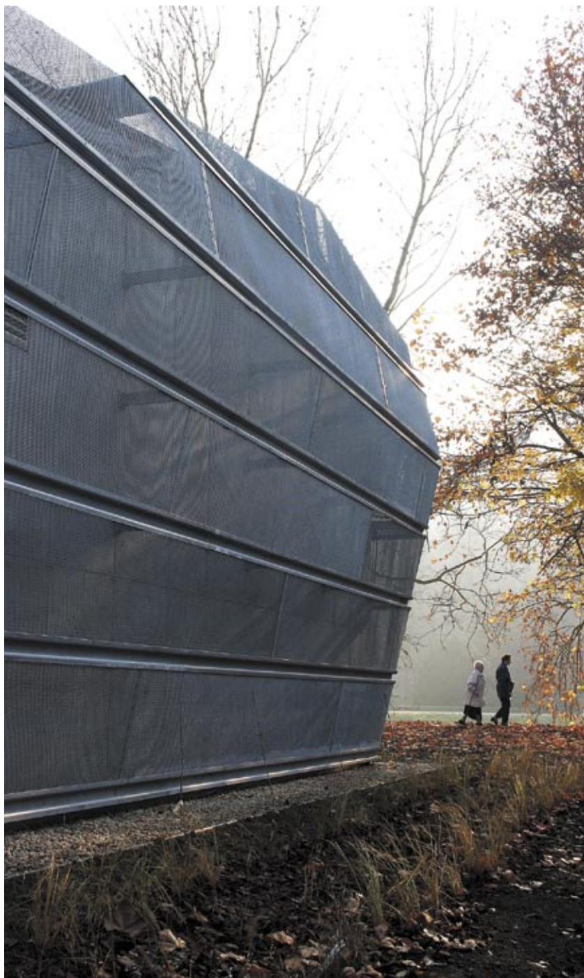
Slika 2: Energetski objekt E-5 v Celju (avtor slike Tomaž Krušec)

Načrtovana sanacija Savinje pa poleg ohranjanja športno-rekreativne funkcije nabrežja nudi možnosti vzpostavitve novih programskih vsebin, ki bi lahko v prihodnosti še dodatno obogatile življenje ob tej