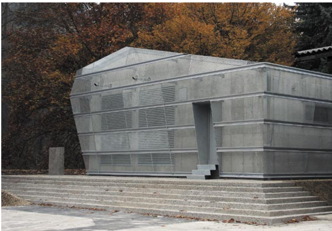
Slika 3: Energetski objekt E-5 v Celju (avtor slike Tomaž Krušec)

Prvotno zahtevana višina objekta (približno 6,5 metra), ki jo je pogojevala vgrajena tehnologija, se je izkazala za mnogo previsoko, saj bi objekt s svojo višino z določenih točk skoraj popolnoma zakril silhueto gradu. Zato je volumen objekta oblikovno znižan tako, da se popolnoma prilagaja obliki generatorjev, ki so postavljeni v notranjosti objekta. Oblika arhitekturnega ovoja tako ni apriorna, ampak se neposredno odziva na tehnološke zahteve programa in tako z najnižjo možno višino kar najmanj vpliva na podobo obrečnega mestnega prostora.