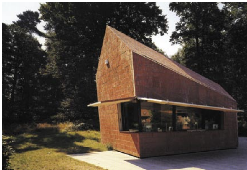
Slika 7: Vhodni paviljoni v Hoge Veluwe park (Nizozemska) arhitekturnega biroja MVDVR (vir: Richardston, P.: XS, Grosse Ideen, kleine BauKunstWerke, DVA, Stuttgart, Muenchen 2002)