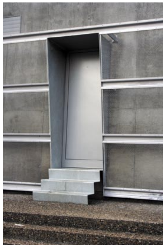
Slika 4: Energetski objekt E-5 v Celju

V primeru oblikovanja Energetskega objekta E-5 ob Savinji v Celju je srečno naključje pripeljalo do realizacije arhitekturno nadpovprečno oblikovanega inženirskega objekta, kar pa nedvomno