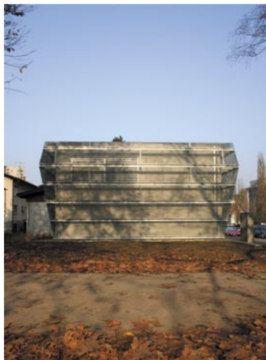
Slika 1: Energetski objekt E-5 v Celju (avtor slike Tomaž Krušec)

Kljub nevarnostim, ki jih prinašajo poplave, pa prostor ob reki Savinji predstavlja osrednjo mestno parkovno površino oziroma prostor, ki nudi meščanom s svojo sprehajalno funkcijo enkratno ambientalno doživetje. To je vitalni del mesta Celje, ki je neločljivo vpeta v njegovo urbano strukturo. S hitro in nepremišljeno gradbeno intervencijo (na primer protipoplavnim betonskim zidom) bi lahko za večno prekinili optično in fizično komunikacijo mesta z reko. Ohranjanje vizualne prisotnosti vode je namreč ključno za oblikovanje tega dela mestnega prostora. Med vsemi večjimi slovenskimi mesti