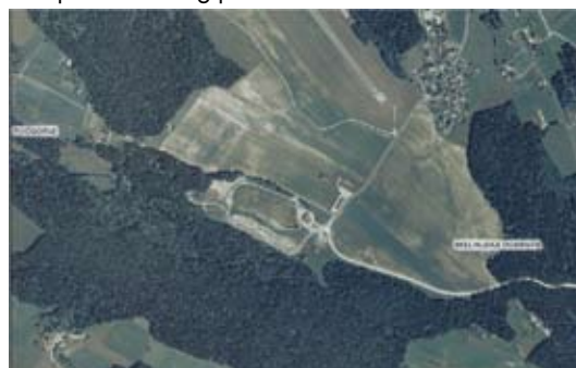
Lokacija KOCEROD iz zraka

Institut za ekološki inženiring je sodeloval pri pripravi projektne dokumentacije in kot pripravljalec dokumentacije vloge za sredstva Kohezijskega sklada. Ministrstvo za okolje in prostor je v vlogi posredniškega telesa preverilo in 4. 9. 2008 v dopisu SVLR tudi potrdilo, da je omenjena vloga administrativno, tehnično, finančno in vsebinsko ustrezna.