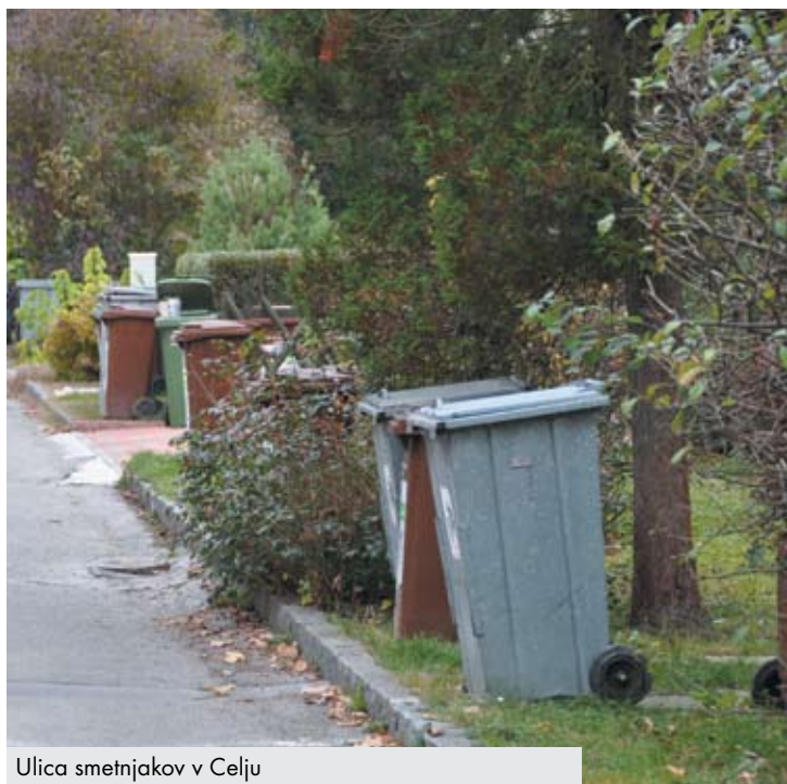
Ulica smetnjakov v Celju

Le malo objektov pri nas je zgrajenih tako, da imajo v pritličju ali kleti posebej pripravljen prostor za smetnjake. Ta je večinoma načrtovan zunaj stavbe. Tudi stare zgradbe v mestnih središčih nimajo posebnega prostora, zato so zabojniki postavljeni na ulice ali na dvorišča stavb. Smetnjakov je dandanes vedno več. Ekološke težnje po ločenem zbiranju odpadkov namreč zahtevajo vedno več zabojnikov, nameščajo se zabojniki za zbiranje stekla, papirja, plastike, kovin, bioloških odpadkov itd. Med zanimivostmi sem zasledila celo novičko, da bodo v finski prestolnici Helsinki postavili smetnjake, ki bodo zažvrgoleli »hvala«, ko bodo uporabniki vanje odvrgli smeti. Nič ni sicer pisalo o tem, če znajo ti tudi presoditi, ali določen odpadek res spada med želeno vsebino. Govoreči smetnjaki so že poželi uspeh tudi v mnogih drugih evropskih mestih. Domišljija seveda nima mej, dejstvo pa je, da je ločeno zbiranje odpadkov za našo bodočnost nujno potrebno. Torej moramo nekako poskrbeti, da bodo vsi različni zabojniki enostavno dostopni, zato da jih bomo za ločeno deponiranje tudi zares uporabljali. Vsekakor pa naj ne bi kazili našega okolja, nasprotno: tudi ta prostor naj bi bil oblikovno zanimiv, odgovarjal naj bi zahtevam modernih urbanih ureditev, naj torej ulice in dvorišča postanejo urejena, naj ta urejenost dvigne ugled kraja in navsezadnje naj urejenost okolice naredi njihove lastnike zadovoljne in jih razbremeni pretiranih stroškov in vzdrževanja.