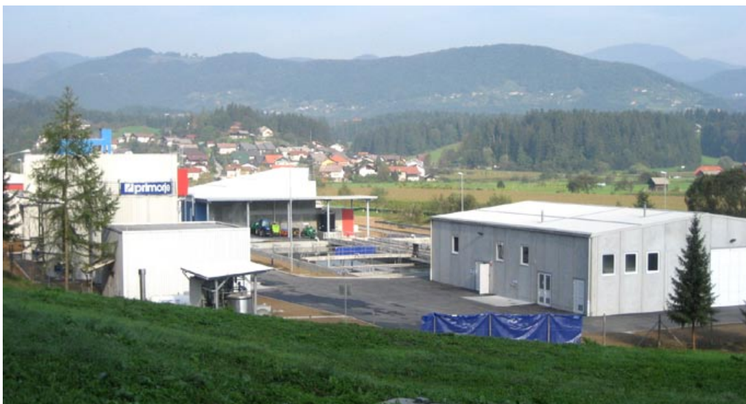
Pogled na ČN Šaleške doline ob otvoritvi