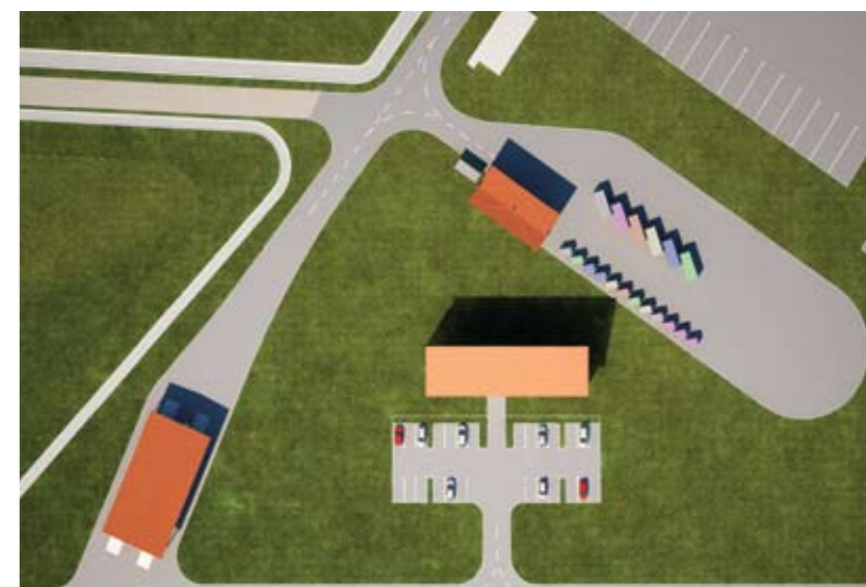
Slika 2: Objekt za MBO Regijskega centra za ravnanje z odpadki Piškornica 3D-prikaz (IPZ Uniprojekt)