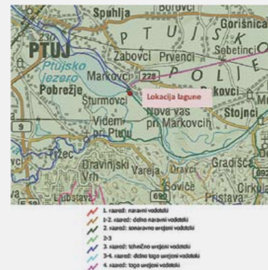
Slika 3: Kategorizacija urejanja vodotokov s prikazom okvirne lokacije lagune (vir: http://gis.arso.gov.si/atlasokolja/ )