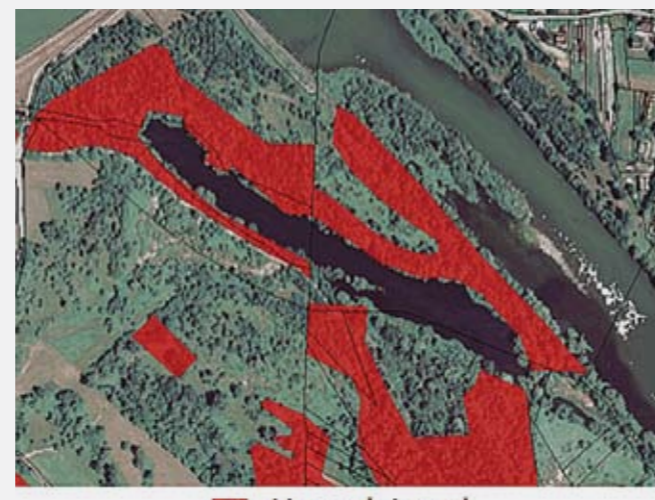
Slika 2: Prikaz varovalnih gozdov v okolici lagune