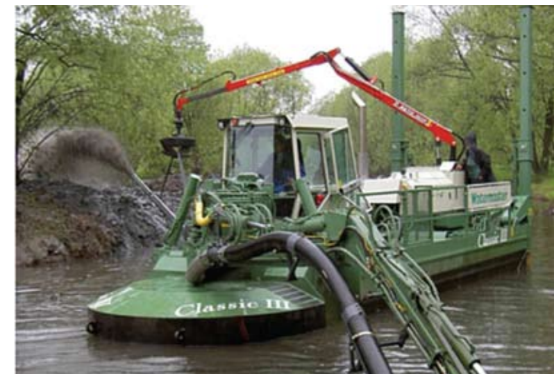
Slika 4: Primer stroja za izsuševanje in izkop mulja - gradbeni stroj Watermaster

Pri izdelavi sanacije so bili postavljeni naslednji cilji: – zmanjšanje tveganja za zdravje, ki je povezano z nakopičenimi odpadki in usedlinami – preprečitev nadaljnega širjenja neugodnih vonjav in s tem izboljšanje bivalnih pogojev – preprečitev nadaljnega onesnaževanja dela podtalnice krajinskega parka – preprečitev vnosa nezaželenih snovi v prehranjevalne verige ter ob visokih vodah izplavljanje mulja v Dravo in na površje parka – z odstranitvijo židkega globokega blata zmanjšati nevarnost za otroke, saj je območje neograjeno – ohranitev vodnega in obvodnega ekosistema, kar vpliva tako na biodiverzitetu, kot tudi na redno bogatjenje podtalnice zavarovanega območja – možnost razvoja različnih razvojnih aktivnosti, ki niso v konfliktu z naravovarstvenimi zahtevami (na primer pešpoti ipd.).